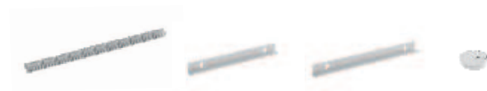
S82 MOCOWANIE KABLI CABLE RACK