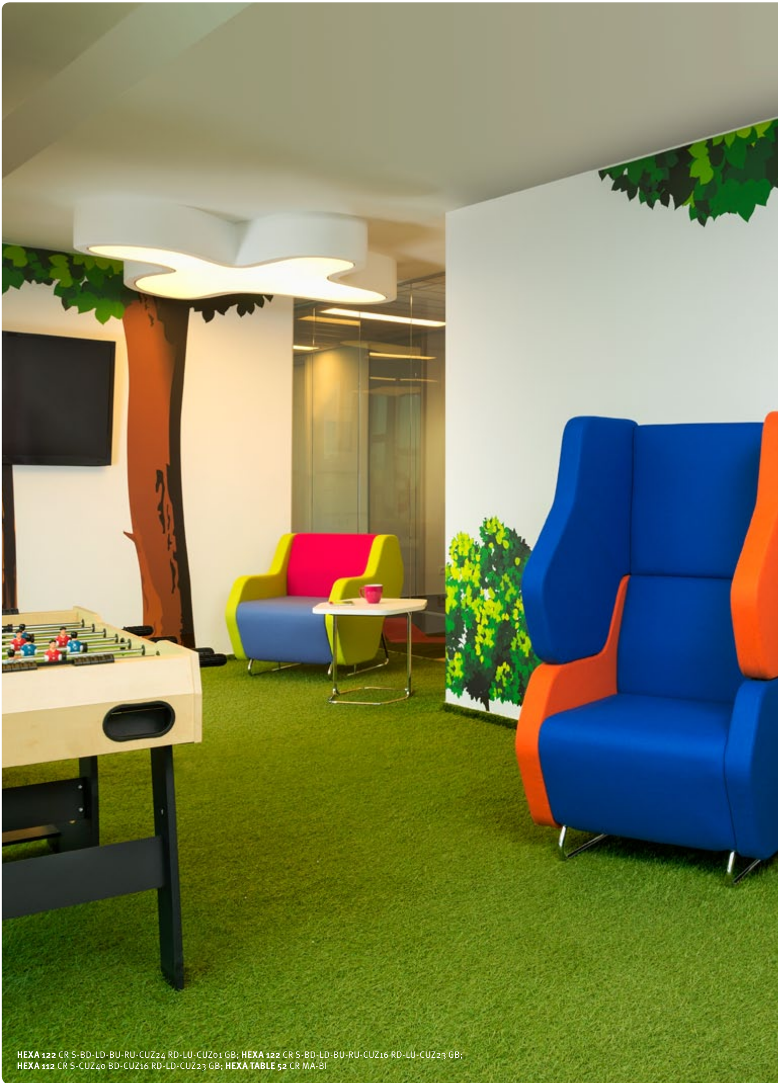
HEXA 122 CR S-BD-LD-BU-RU-CUZ24 RD-LU-CUZ01 GB; HEXA 122 CR S-BD-LD-BU-RU-CUZ16 RD-LU-CUZ23 GB; HEXA 112 CR S-CUZ40 BD-CUZ16 RD-LD-CUZ23 GB; HEXA TABLE 52 CR MA-BI