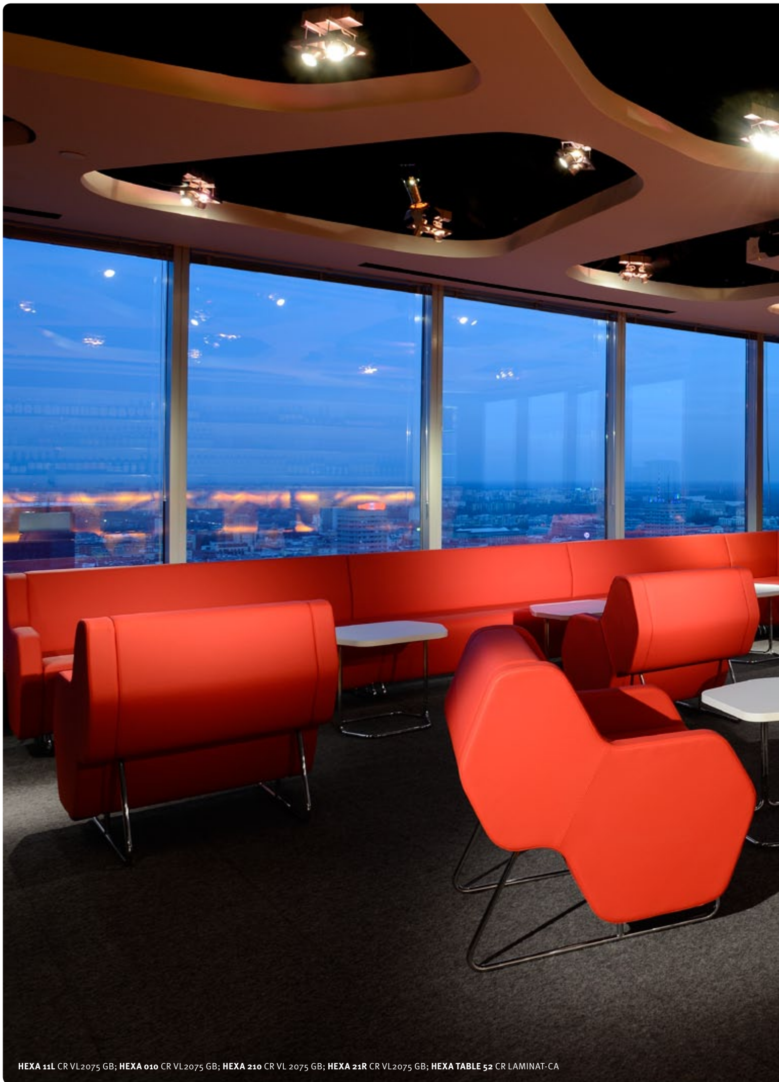
HEXA 11L CR VL2075 GB; HEXA 010 CR VL2075 GB; HEXA 210 CR VL 2075 GB; HEXA 21R CR VL2075 GB; HEXA TABLE 52 CR LAMINAT-CA