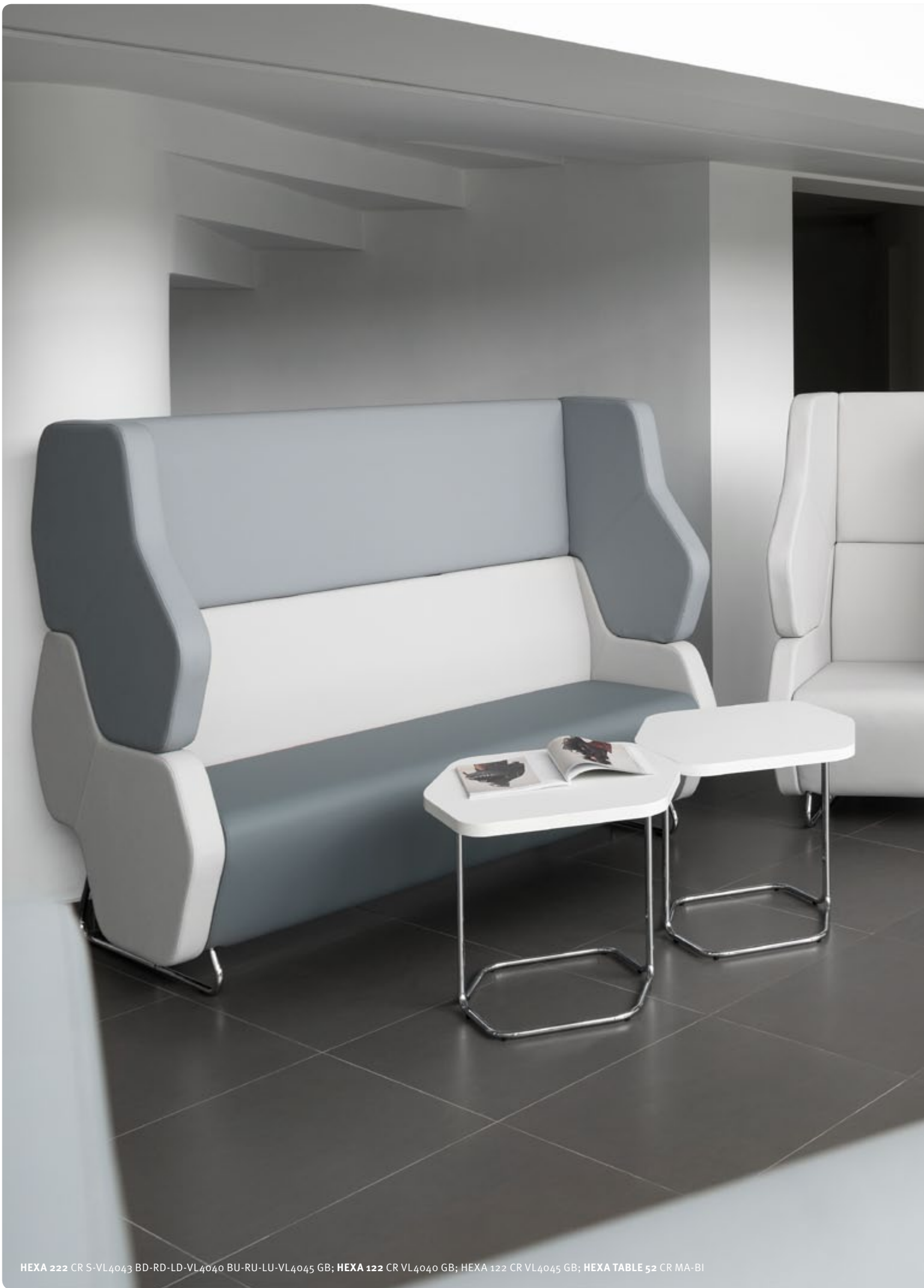
HEXA 222 CR S-VL4043 BD-RD-LD-VL4040 BU-RU-LU-VL4045 GB; HEXA 122 CR VL4040 GB; HEXA 122 CR VL4045 GB; HEXA TABLE 52 CR MA-BI